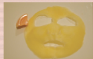
温熱パック後の口ウ。右のかけらは パック前の口ウ。